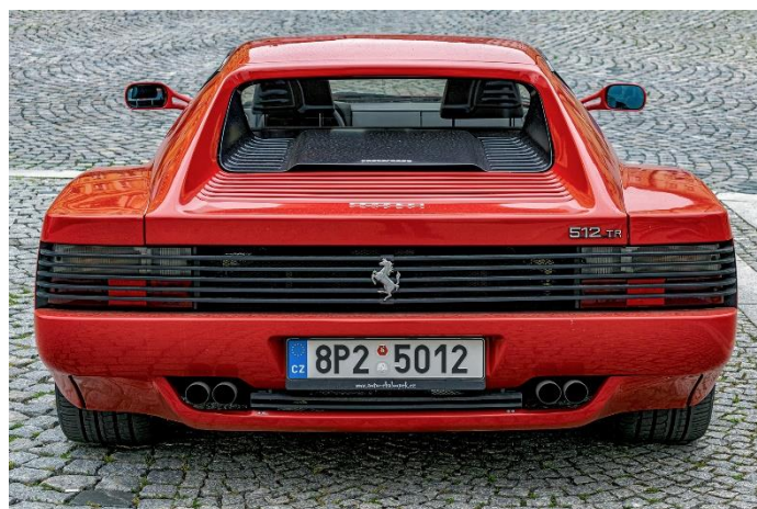
I doprovodný program, konkrétně výstava vozů u Morového sloupu, rozhodně stála za to, foto: Miroslav a Michal Falta