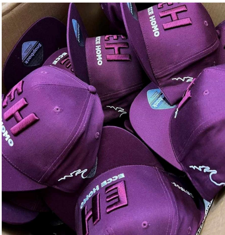
nový merch, např. unikátní kšiltovky Ecco Homo