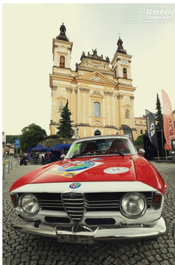
nádherné vozy značky Alfa Romeo, foto: R. Roguski