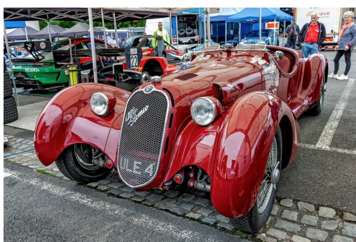
Aero Minor Sport a Alfa Romeo Giulietta