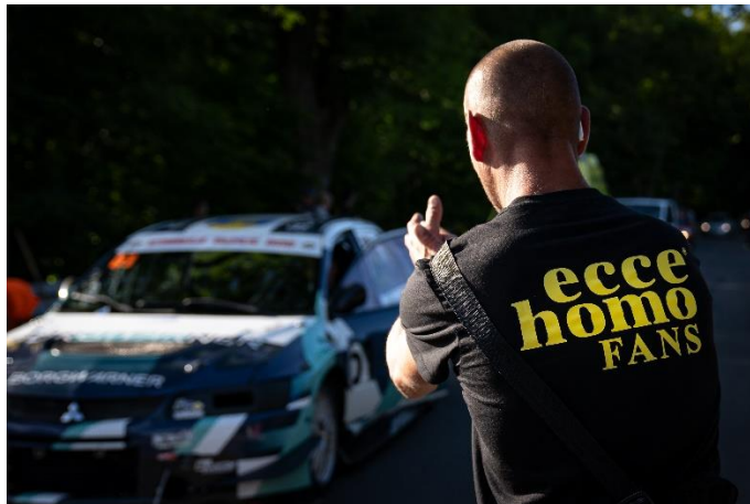
fanoušci, foto: David Sedlák, Anna Czuba, Tomáš Suchý

Automotoklub Ecce Homo Šternberk v ÚAMK na závěr děkuje VŠEM, kteří jakoukoliv měrou přispěli k úspěšné organizaci dalšího ročníku tohoto letitého závodu a pomáhají tak budovat prestiž značky ECCE HOMO.