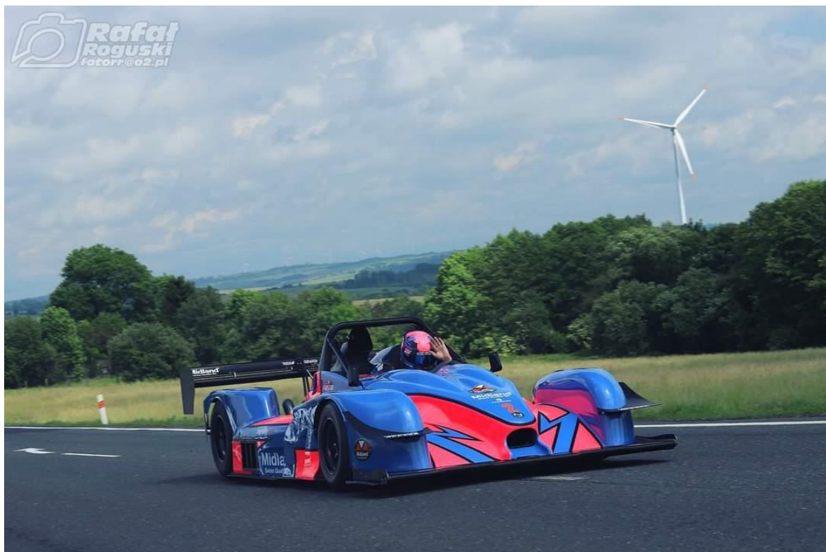
Švýcar Robin Faustini – jezdec s nejvyšší naměřenou rychlostí na Ecce Homo 2024, foto: Rafal Roguski