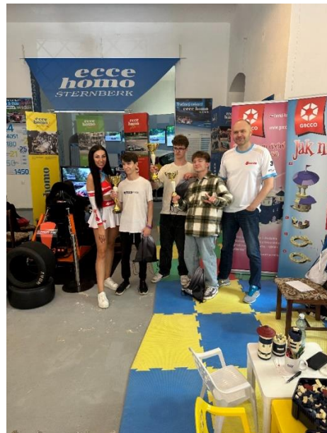
atmospféra virtuálních závodů Ecce Homo 2024 v EH Parku