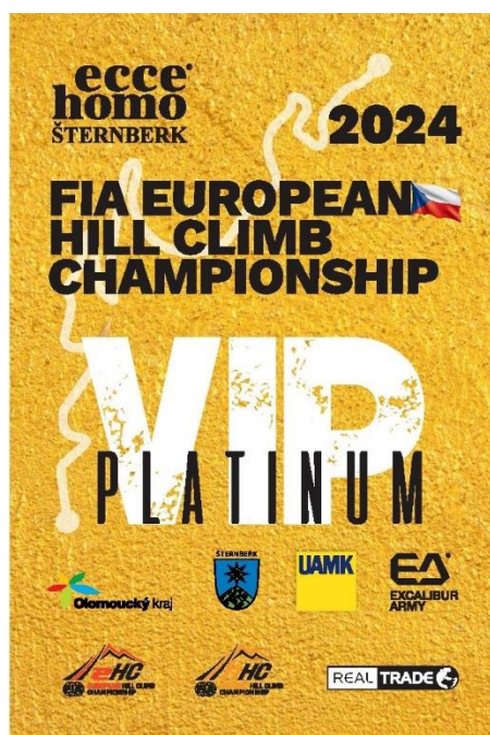
VIP karta pro účastníky letošního premiového programu

Pořadatelé také na letošní rok připravili VIP program PREMIUM HOSPITALITY, pro ty, kteří si chtěli užít závody z pozice prémiového hosta. Tito návštěvníci měli svého průvodce i řidiče, který je převážel po uzavřené trati, měli zázemí ve VIP stanu s caterigem, dostali oficiální merch a spoustu dalšího. Věříme, že tento pilotní projekt bude mít v dalších letech více a více zájemců.