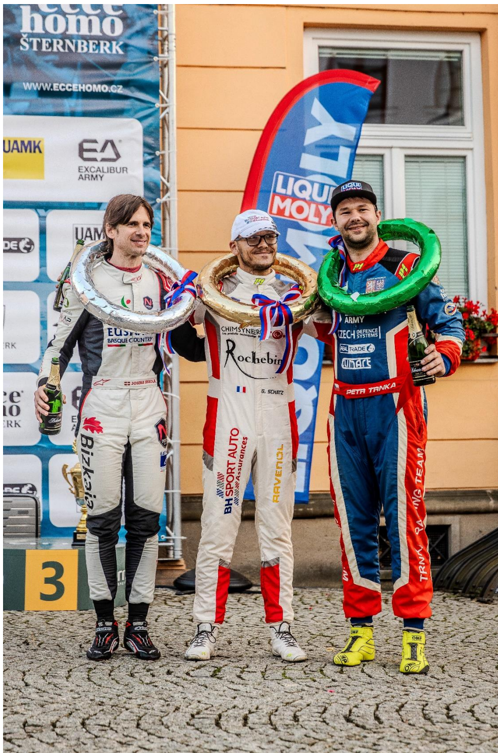
absolutní vítězové