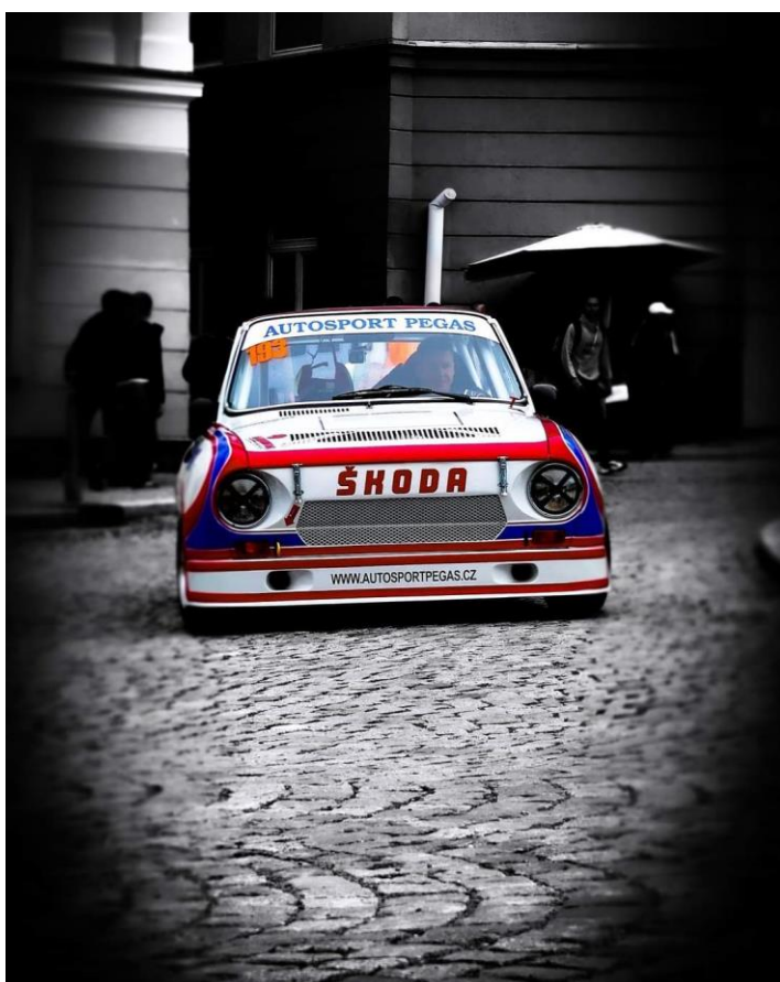
Pavel Kolář – Škoda 130 RS, foto: Love Motorsport Racing