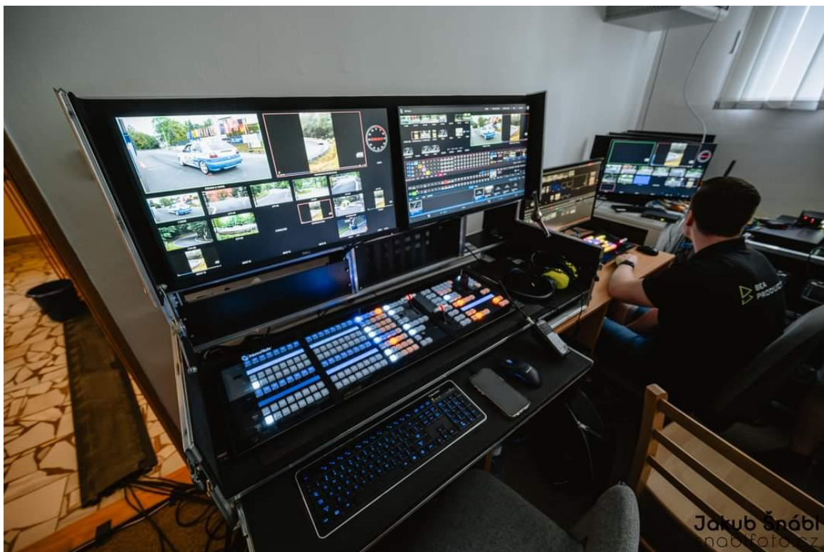
pohled do režie profiků z BEA Production

Kromě livestreamu pořadatelé zapracovali na opravě rozhlasu po trati. V této oblasti je ještě stále co zlepšovat, ale podařilo se na mnoha místech rozhlas opravit a poskytnout tak divákům cenný komentář obou pánů.